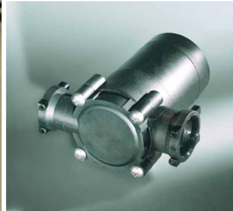
Turbina per idroaccensione