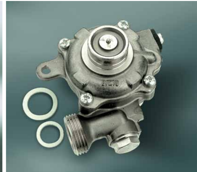
Gruppo acqua in ottone